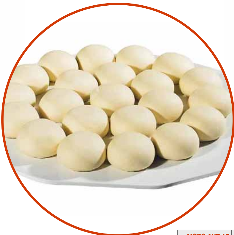
Piatto - Plate - Plateau - Plato